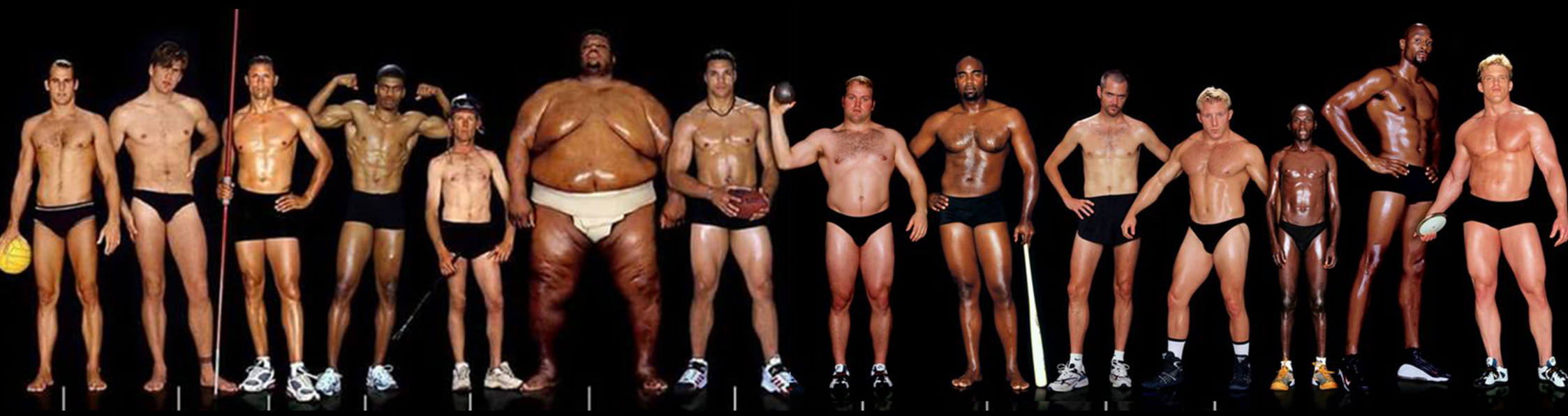
Les corps de sportifs vus par le photographe Howard Schatz. 2002